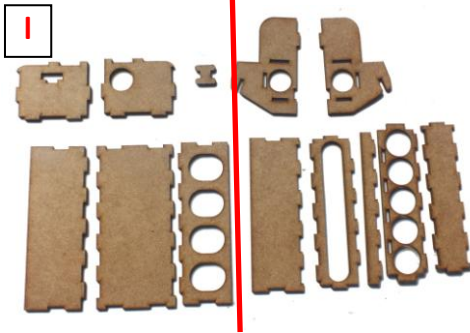
1 die zu klebenden Teile

Obere und untere Schubladen: Untere Schubladen haben die etwas längeren Teile. Im Bild links.