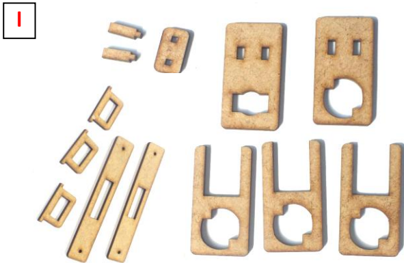
1 die Teile für den Lampenhalter

Schrauben & Muttern in Tüte mit Agitatorkugeln. Die Arme wie die Verschlusschlüssel zusammenbauen. Siehe Setup Anleitung für Aufbau der Lampe.