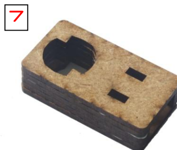
7 Dann die geschlossene Platte mit dem großen Schlüsseloch (wieder Loch gleich wie die anderen) sehr passgenau auf die offenen Platten Kleben. DIES NICHT ZUSAMMENDRÜCKEN! Hier will man durch den Kleber erreichen, dass minimale Abstände zwischen den Platten sind, damit die Verschlusschlüssel leicht eingeführt werden können.

DIESE EINHEIT NICHT ZUSAMMENDRÜCKEN! Keinen Kleber in den Schlüsselöchern oder Ausschnitten!