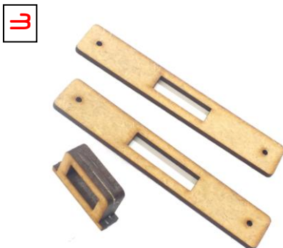
3 Lampenhalter: drei der Halteringe sehr bündig übereinander kleben