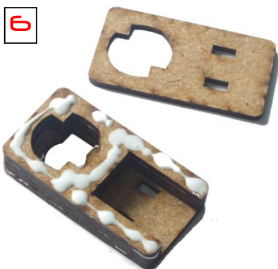
6 Armhalter: klebe 3 der offenen Platten SEHR bündig auf die Platte mit dem kleinen Schlüsseloch. Alle Löcher gleich herum, und viel Kleber nehmen.