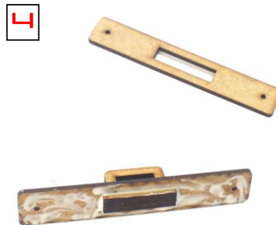
4 diese dann in die Platte mit dem kürzeren Schlitz einkleben.